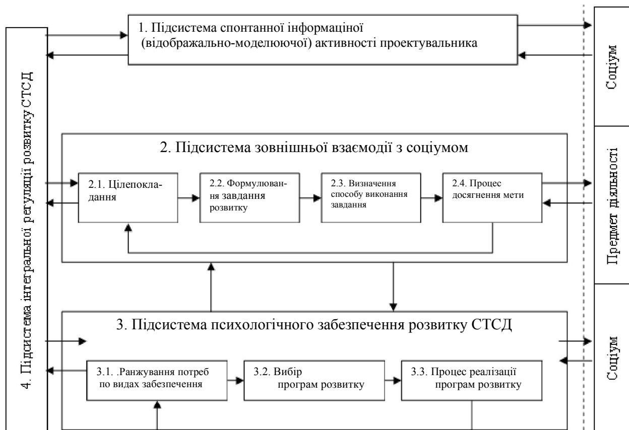
Рис. 1. Структурна модель розвитку СТСД