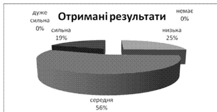
Рис. 2. Ступінь переживання за шкалою "Оцінка втрат"

Також в ході експериментального дослідження був використаний опитувальник "Втрати і придбання персональних ресурсів" (ОВІР). Даний опитувальник поділений на дві шкали: ступінь переживання за шкалою "Оцінка втрат". За даною шкалою були отримані наступні результати: 55,5% старшокласників мають середній ступінь переживання, 25,5% - низьку і 19% високий ступінь переживання. Ступінь переживання за шкалою "Оцінка придбання": 56% - середня, 35% - низька і 9% - високий ступінь переживання. Наочно результати дослідження представлені на рис. 2, рис. 3.