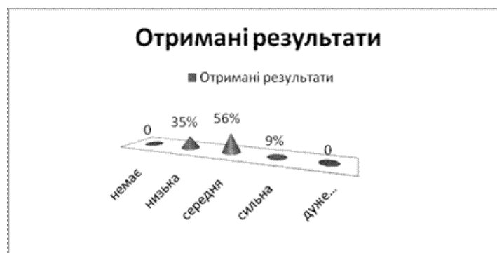
Рис.3. Ступінь переживання за шкалою "Оцінка придбання"

Висновки. За результатами проведеного дослідження, на підставі отриманих результатів можна зробити наступні висновки: