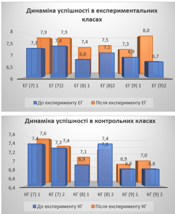
Рис. 1. Порівняльна динаміка середньої оцінки в експериментальних і контрольних групах

У контрольних групах зміни середньої оцінки були значно менш вираженими. У 7 класах приріст становив з 7,4 до 7,6 та з 7,3 до 7,4. У 8 класах незначне зростання зафіксовано лише в одному випадку (з 6,9 до 7,1), тоді як в іншому позитивної динаміки не спостерігалось (з 7,4 до 7,3). У 9 класах зміни також були мінімальними – з 6,8 до 6,9 та з 6,8 до 7,0.